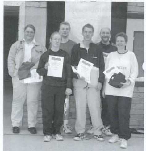
Die Sieger im Mixed.