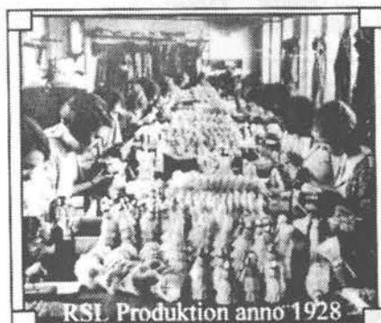
RSL Produktion anno 1928