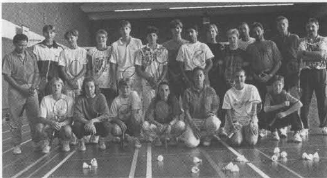
Die DBV-Jugendauswahl im SBZ in Malente

Schwerpunkt war natürlich die Trainingsarbeit in der Sporthalle (täglich ca. 7 Stunden), aber auch von den anderen sportlichen Möglichkeiten- wie Schwimmhalle, Sauna und Tennisplatz- wurde zusätzlich Gebrauch gemacht.