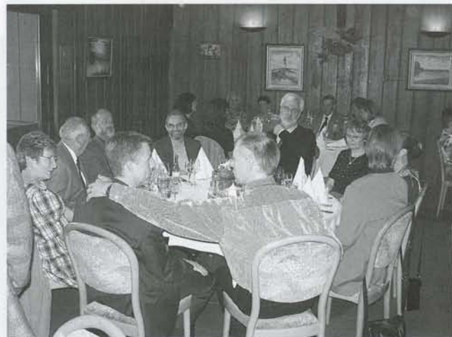
An allen Tischen herrschte eine fröhliche und ungezwungene Stimmung.