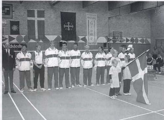
Die Dänische Mannschaft U 19 war mit seinen stärksten Akteuren nach Eutin angereist.

zweiten und dritten Durchgang mit viel Biss, war nahe dran, hatte am Ende jedoch drei Punkte in Folge vergeben. Schade!