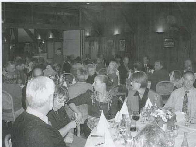
Viele Gäste hatten sich zum Jubiläumsempfang des SHBV eingefunden.

Zwei Jahre gab es in Schleswig-Holstein keinen Landestrainer bis dann endlich