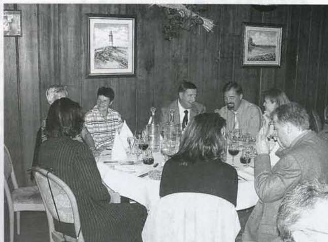
Gesprächsstoff gab es an allen Tischen, viele Erinnerungen wurden ausgetauscht.

der heute 79jährige, sondern es waren elf Spiele zu absolvieren und dabei