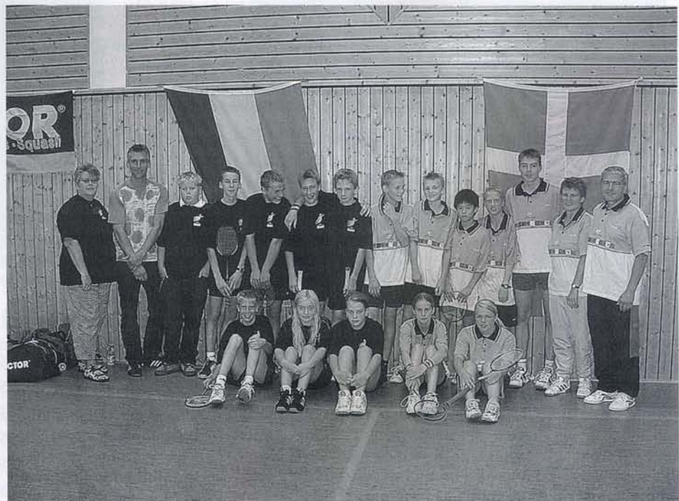
Gemeinschaftsfoto der SHBV-Auswahl mit den dänischen Gästen und Betreuern aus Lolland/Falster.