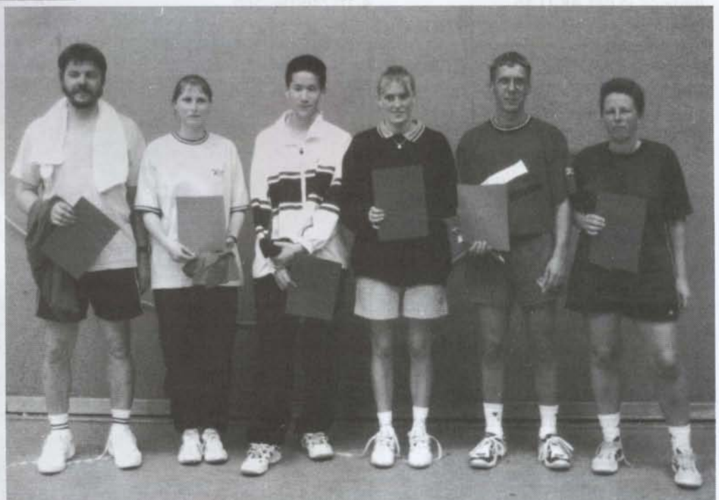
Die Platzierten der Rangliste des KBV Plö/NMS/Ki